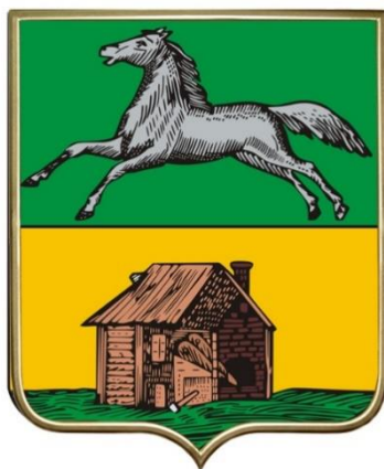
СХЕМА ТЕПЛОСНАБЖЕНИЯ В АДМИНИСТРАТИВНЫХ ГРАНИЦАХ ГОРОДА НОВОКУЗНЕЦКА НА ПЕРИОД ДО 2032 ГОДА (АКТУАЛИЗАЦИЯ НА 2025 ГОД)